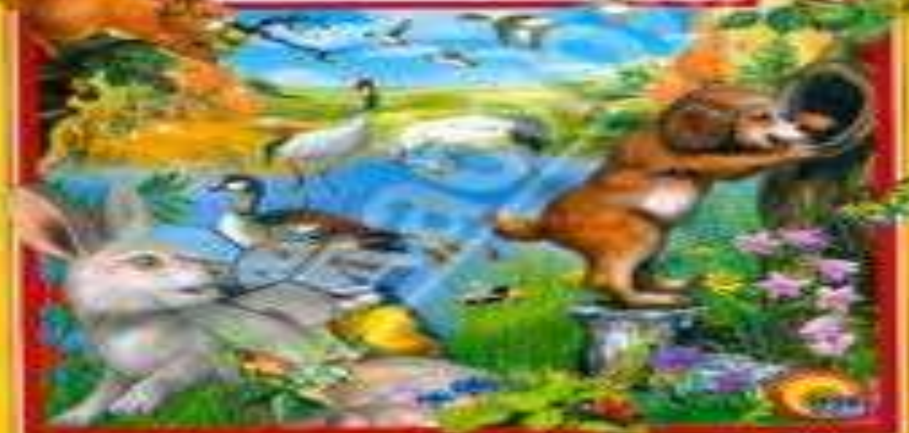
Иллюстрация В.В. Бицилли